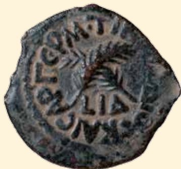
Römischer Prokurator Antonius Felix (54–60), Perutah, geprägt in Caesarea Maritima 54 n. Chr. Rs: Zwei Palmblätter; Griechisch: Tiberius Claudius Caesar Germanicus, Jahr 14