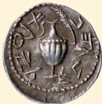
2. Jüdischer Krieg, Zuz, geprägt 133 n. Chr. Vs: Kanne; Paläo-Hebräisch: Für die Freiheit von Jerusalem