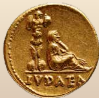
Vespasian (69–79), Aureus, geprägt in Rom 69 n. Chr. Rs: IVDAEA; Trauernde Iudaea neben einem Tropaium sitzend