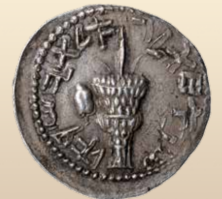
2. Jüdischer Krieg, Sela, geprägt im Jahr 1 (132 n. Chr.) Rs: Lulav-Bündel, links Etrog-Frucht; Paläo-Hebräisch: Jahr 1 der Erlösung von Israel

** Teilnahme frei mit gültigem Museumsticket, keine Anmeldung erforderlich.