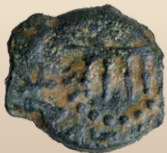
Antigonos (Mattatyah) (40–37 v. Chr.), Perutah, geprägt in Jerusalem Vs: Schaubrottisch; Paläo-Hebräisch: Mattatyah, der Hohepriester

ÖFFNUNGSZEITEN Di – So, 10 – 18 Uhr OPENING HOURS Tue – Sun 10 a.m. – 6 p.m.