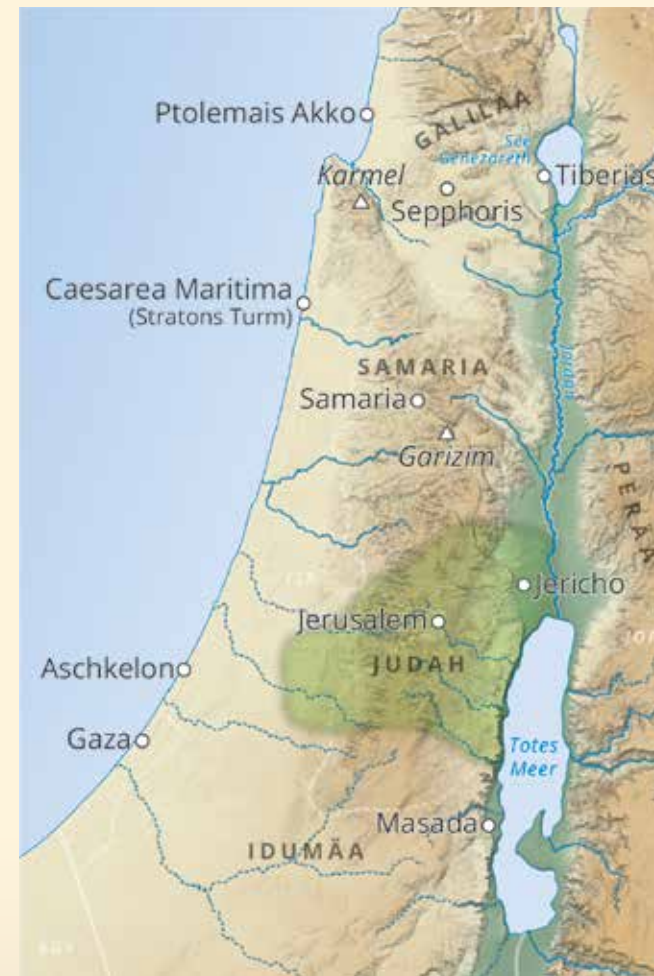
Provinz Judah im 4. Jahrhundert v. Chr.

Ancient Jewish coins were minted from the fourth century BC to the reign of Emperor Hadrian in the second century AD; they offer unique insights into the history and civilization of ancient Israel. Coins document the period of Persian rule, the time of the Hasmonean dynasty, the reign of Herod the Great, and, last but not least, they bear witness to the two Jewish-Roman wars. In AD 135 the Second Jewish War, also known as the Bar Kokhba revolt, led to the destruction of Jerusalem, and thus the end of Jewish coinage. In the course of these centuries the people of the Jewish world witnessed sweeping political and religious changes that would deeply influence Jewish culture and religion. For us today, these coins function as original documents that bear witness to dramatic times, and their images and inscriptions document the identity and self-perception of the contemporary Jewish elites. The exhibition is organized in collaboration with the Israel Museum Jerusalem and the University of Vienna (Department for Numismatic Studies and Department of Geography and Regional Research); the Israel Museum has never before loaned artefacts for an exhibition in Austria, and many of them have never been shown outside of Israel before.