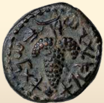
2. Jüdischer Krieg, Bronzemünze, geprägt im Jahr 1 (132 n. Chr.) Rs: Weintraube; Paläo-Hebräisch: Jahr 1 der Erlösung von Israel